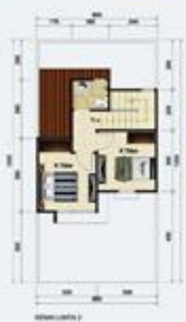
TYPE SAPHIRE LB/LT 65/72