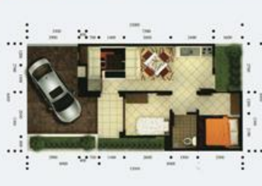
TYPE EMERALD LB/LT 45/78