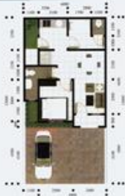
TYPE BOUGENVILLE LB/LT 80/78